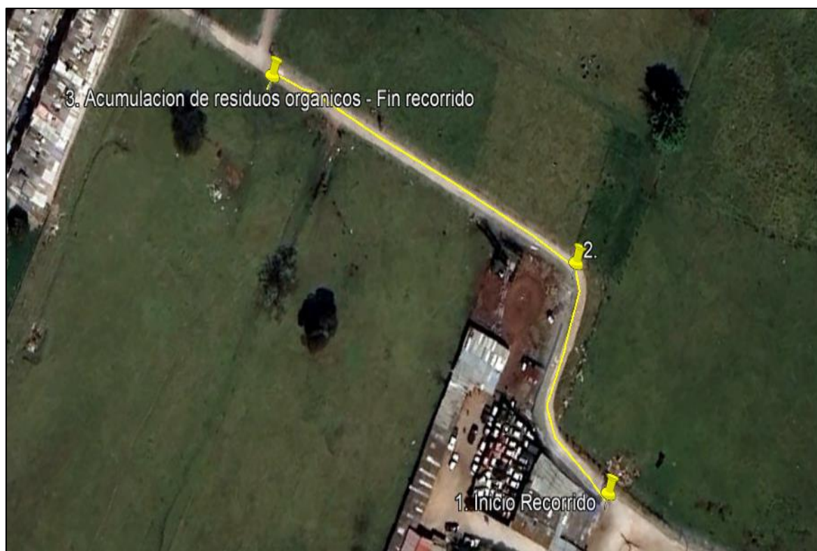
Ilustración 1. Recorrido verificación ambiental -Vereda Siete Trojes

Se realizó recorrido de control y vigilancia de los componentes ambientales en áreas rurales del municipio de Funza, vereda Siete Trojes, el día 19 de junio de 2024, desde las coordenadas 4°43'23.352"N - 74°13'15.06"W hasta las coordenadas 4°43'22.008"N - 74°13'19.607"W (ver ilustración 1. Ruta amarilla), con el fin de verificar las condiciones ambientales, identificar posibles afectaciones a los recursos naturales y realizar las acciones de prevención correspondientes.